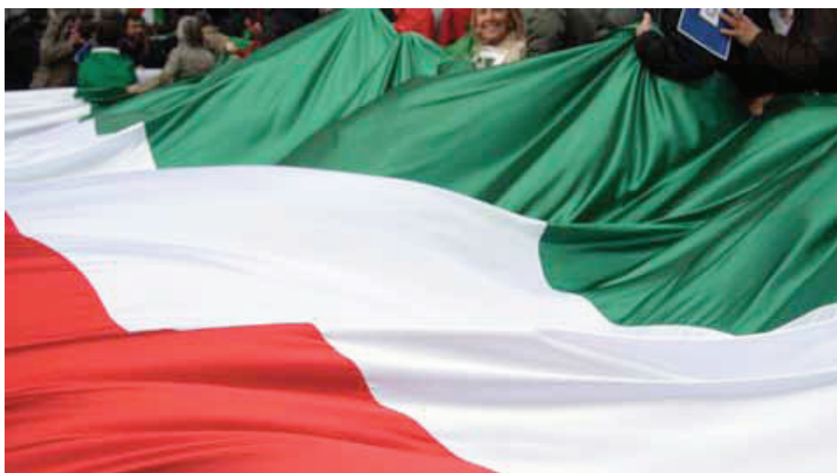
Manifestazione in difesa della Costituzione

La nostra Costituzione è ancora, in gran parte, da attuare. Le sue novità erano molte e profonde, se realizzate avrebbero portato a un sostanziale capovolgimento rispetto al passato; la trasformazione più consistente era legata alla realizzazione dei diritti sociali, a un nuovo rapporto fra le persone e fra le persone e le cose: l'inattuazione più grave riguarda appunto i diritti sociali. Così non è stato raggiunto l'obiettivo dei Costituenti di creare un mondo più umano, di costruire un sistema diverso di relazioni dei cittadini fra loro e con il potere, di consentire a tutti di vivere una vita "dignitosa", di essere